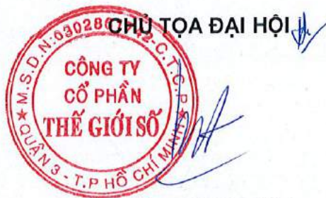
ĐOÀN HỒNG VIỆT